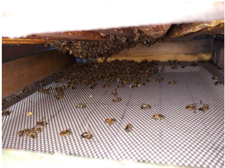
Abbildung 2: ...ein Blick auf den Gitterboden liefert die Erklärung!

Die Auswirkung von Totenfall auf das Ergebnis der Gemülldiagnose zeigen die Abbildungen 1 und 2 (aktuelle Aufnahmen).