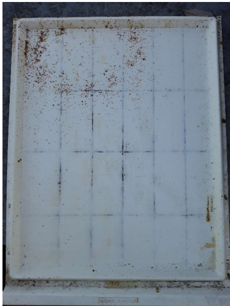
Abbildung 1: Dieses Gemüllmuster lässt vermuten, dass etwas nicht stimmt!

Völker, bei denen keine, oder „abnormale“ Gemüllstreifen auf der Schublade zu sehen sind, sollten Ihr Misstrauen sofort wecken!