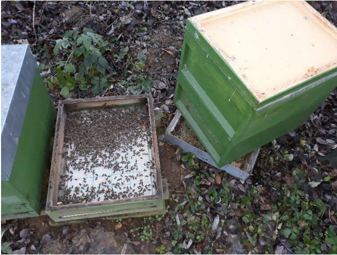
Abbildung 3: Bei solch einem Totenfall muss der Boden auf jeden Fall geputzt werden! Boden mit Stockmeisel lockern – Volk als Ganzes kurz zur Seite stellen – putzen und Volk zurück – 2-3 Minuten ☺ (falls Sie Krankheiten oder sonstiges vermuten: Totenfall genau untersuchen und ggfs. Probe einfrieren).